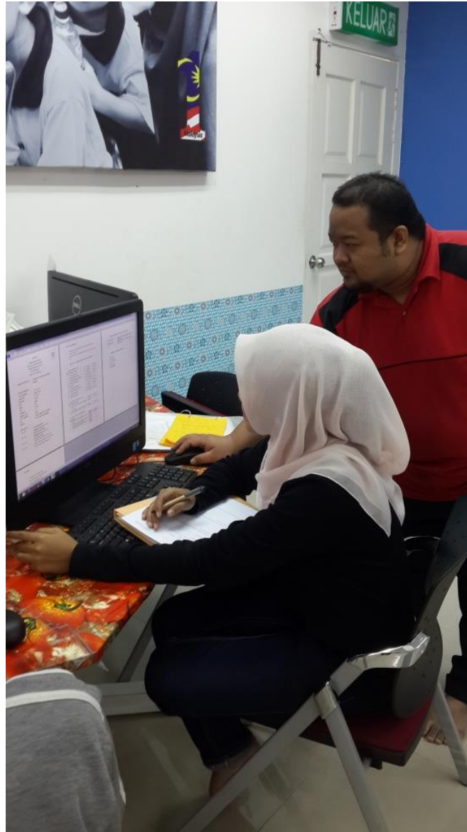
Caption : Petugas Pi1M membantu membina resume yang baik