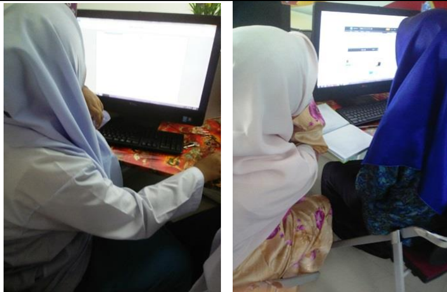
Peserta sedang mencari maklumat tentang pantun di internet